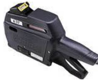
Typ 5.37 - 6.37* 5 oder 6 Stellen Preisdruck, Codierung, Datum