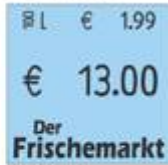
Typ 16.29 GP