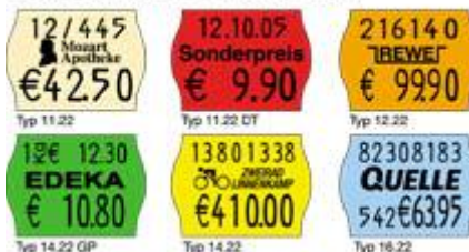
Typ 11.22 - Typ 16.22 11 bis 16 Stellen Preisdruck, Codierung, Datum, Grundpreis