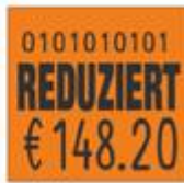
Typ 16.29 S