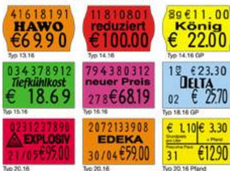
Typ 13.16 - 20.16 13 bis 20 Stellen Preisdruck, Codierung, Datum, Grundpreis, Pfand Weitere Standardgrößen und -farben