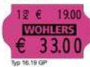
Typ 16.19 GP