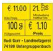
Typ 20.29 GP