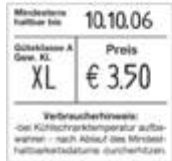
Typ 20.29 EB