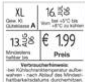
Typ 20.29 EA