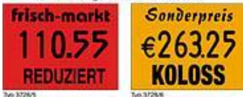
Typ 3728/5* Typ 3728/6* 5 oder 6 Stellen Preisdruck Codierung, Datum, Aktionsauszeichnung *optional Klischeeschieber